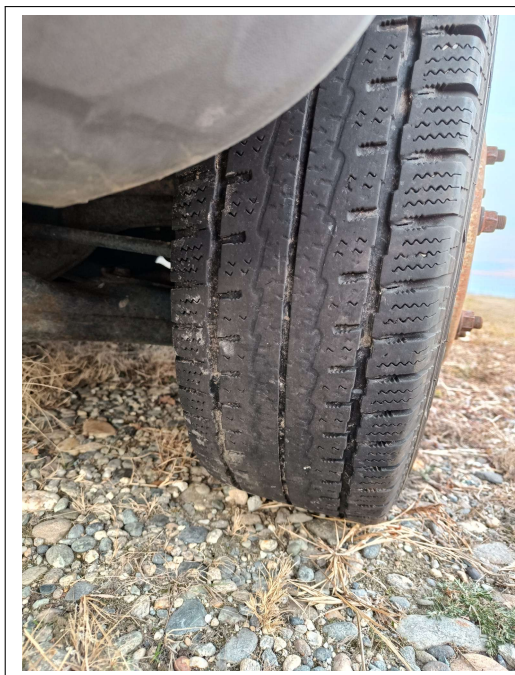
Figura 17.3: Scuolabus: vista pneumatico