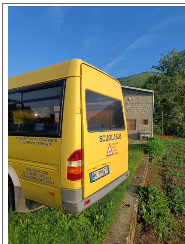
Figura 17.2: Scuolabus: vista posteriore