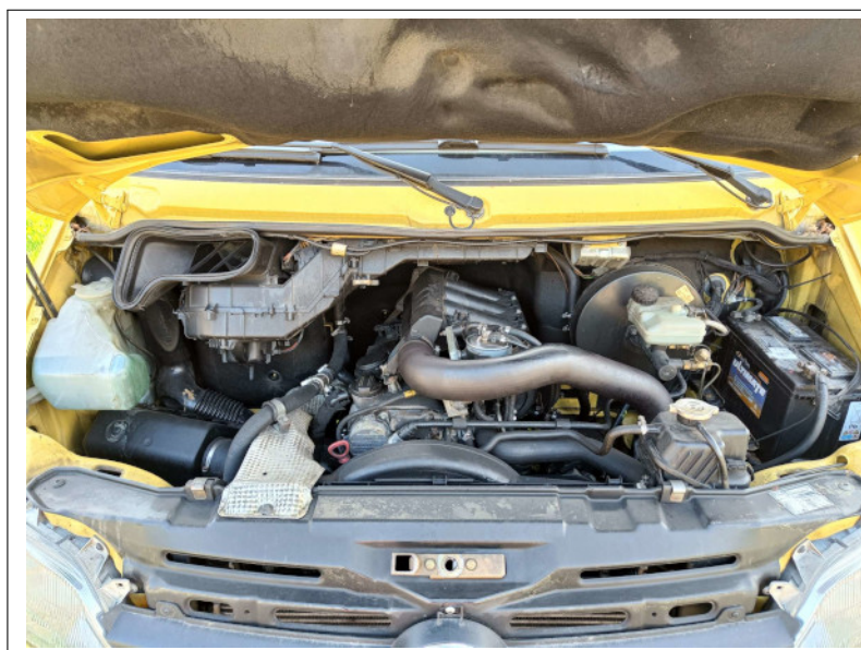
Figura 17.6: Scuolabus: vista motore