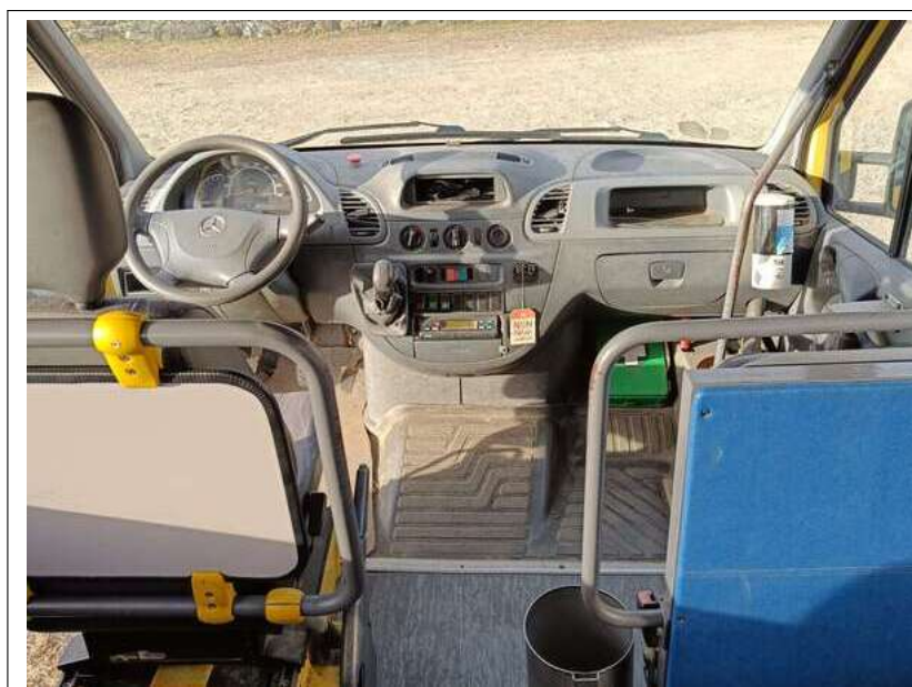
Figura 17.4: Scuolabus: posto guida