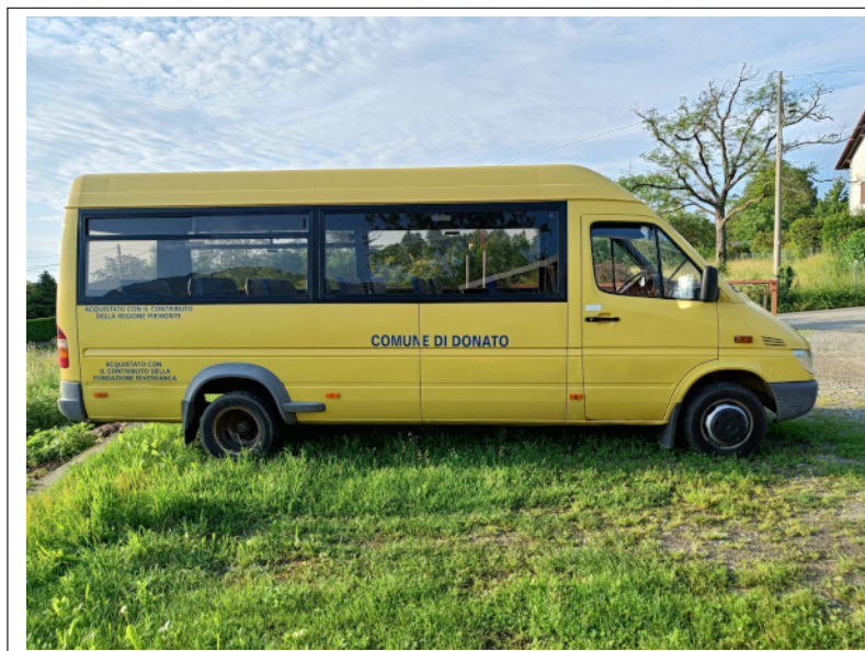
Figura 17.1: Scuolabus: vista laterale