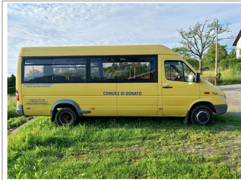
Figura 17.1: Scuolabus: vista laterale